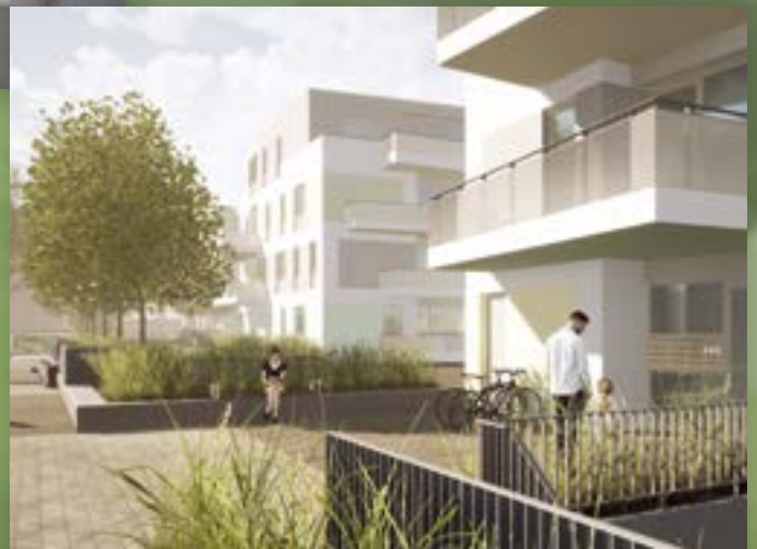
Visualisierung BWG Stadthäuser