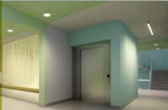
Visualisierung BWG Stadthäuser, Foyer